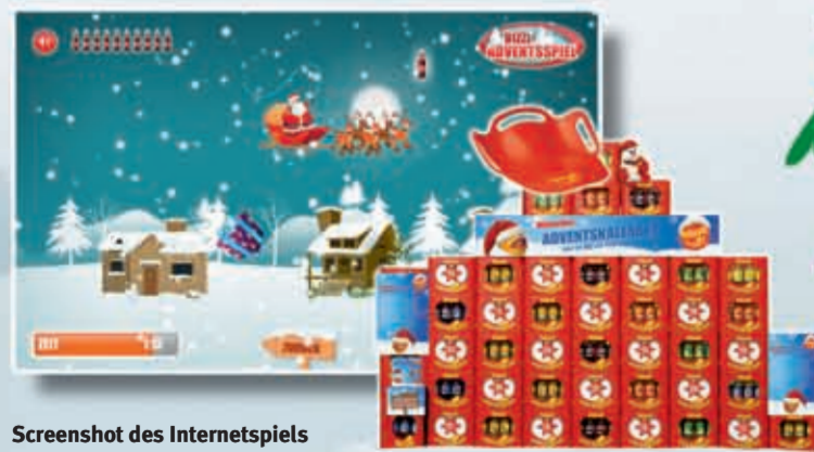
Screenshot des Internetspiels

Zum vierten Mal in Folge trägt der Adventskalender von bizzl auch in diesem Jahr zur vorweihnachtlichen Stimmung im Fachgroßhandel und Lebensmitteleinzelhandel maßgeblich bei. Und Hassia Mineralquellen kann sich erneut über eine Rekordbeteiligung freuen: Sage und schreibe rund 600 Outlets machen mit! Kein Wunder, lassen doch die täglichen Gewinnchancen zusätzliches Geschäft erwarten. Daneben gibt es zum ersten Mal auch die Möglichkeit, via bizzl-Homepage am diesjährigen Adventskalender mitzumachen und sich einen der 24 attraktiven Tagespreise zu angeln.